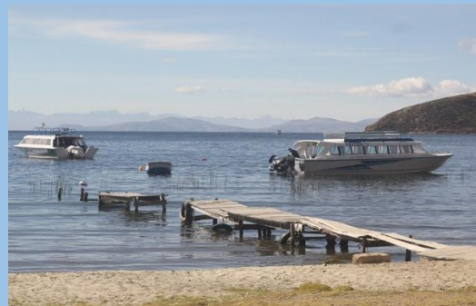
Sagrada Isla del Sol Lago Titikaka - Bolivia