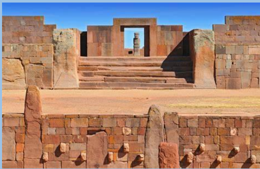
Tiwanaku y sus templos antiquísimos Bolivia